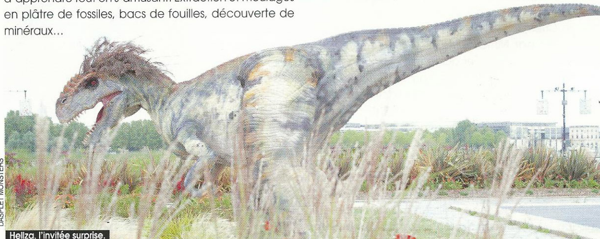
Hellza, l'invitée surprise.

Du 23 au 25 janvier, salle d'exposition du stade des Costières, de 9h à 18h30. Entrée : 4 € pour les adultes et 1,50 € pour les enfants. www.expo-mineraux-nimes.fr